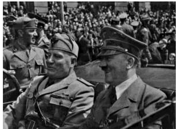
Adolf Hitler na Benito Mussolini (wa Italya), le Munich, aJarimana, hi Khotavuxika wa 1941 (06/1941)

Loko kuheli YMI, leyilwiwiki hi 1914-1918, matiko mabohi tiko dzra Jarimana ngopfu svinene, lakakuva tiko ledzro afa dzrihohlokile hi tlhelo dzra vukosi ni mafumela. Loko kutlhasa lembe dzra 1939, Jarimana afa afumiwa ha Adolf Hitler, muzrangel