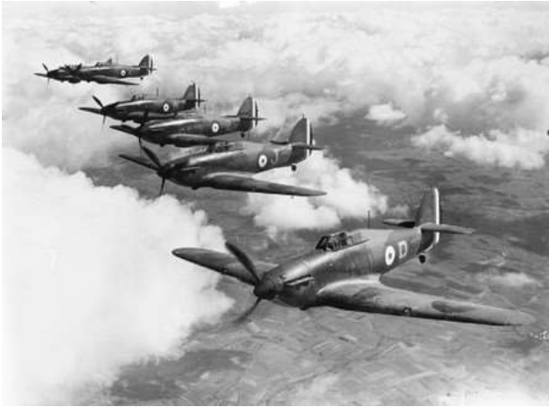
Svihahampfhuka sva Yimpi sva Mfumu wa Bretanya

xa Kungahlaselani ka Jarimana na Sovhiyetka le Moxkovhu antsrhaku ka mabulu ya xihundla lamaviki kone hi 23-24 ka Mhawuri (23-24/08). Axi-pfumelelanwini lexo, vajarimana ni vasovhiyetka vatsrimbi lesvaku vata-yavelana Polonya, laha xin'we xa sviyenge svizrazru xa le mpeladambu afaka xitalumba Jarimana, kuvona sviyenge svibidzri sva svizrazru svisala ni Ntlhanganu wa Sovhiyetka.