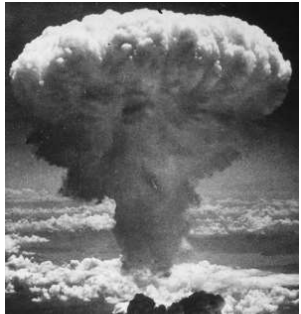
Tlavi dzra bomba dzra ntamu ahenhla ka Nagazaki, Japani, hi 9 ka Mhawuri, ka 1945 (9/08/45)

lesvi svihumeleleli ampundzrwini wa 1 ka Ntsrhati (1/09). Matiko ya Bretanya Lwenkulu na Fransa mayanguli hi kutivisa yimpi na Jarimana hi 3 ka Ntsrhati (2/09), kuva kusungulisa xisvosvo Yimpi ya Vubidzri ya Misava. YMII yiyihela hi 2 ka Ntsrhati ka 1945 (2/09/1945) hi kufungiwa ka mapapela ya mayipheli hi tiko dzra Japani le Nsongweni ya Tokyo, angalaweni ya yimpi ya Tiko dzra Amerika.