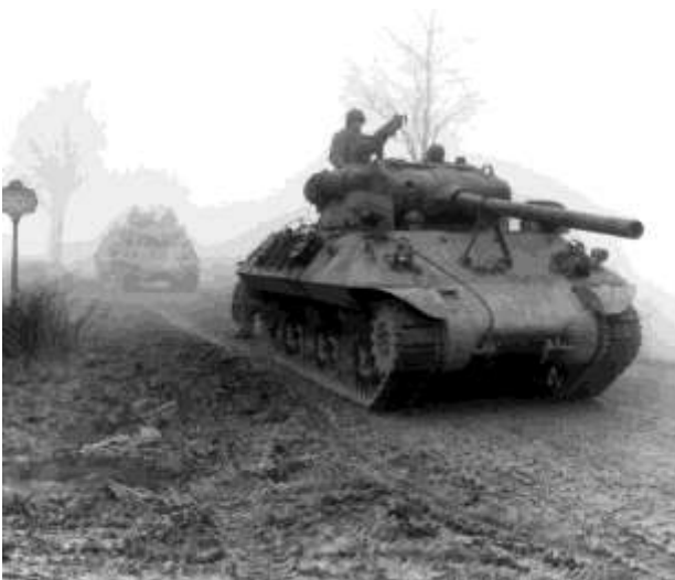
Thangi dzra yimpi dzra vamerika hi YMII, goodfreephotos

xa Kungahlaselani ka Jarimana na Sovhiyetka le Moxkovhu antsrhaku ka mabulu ya xihundla lamaviki kone hi 23-24 ka Mhawuri (23-24/08). Axi-pfumelelanwini lexo, vajarimana ni vasovhiyetka vatsrimbi lesvaku vata-yavelana Polonya, laha xin'we xa sviyenge svizrazru xa le mpeladambu afaka xitalumba Jarimana, kuvona sviyenge svibidzri sva svizrazru svisala ni Ntlhanganu wa Sovhiyetka.